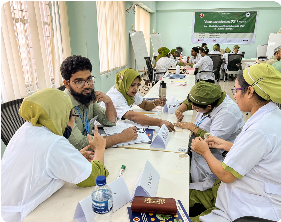
Réparties en quatre cohortes, 96 infirmières ont participé au LFC Bangladesh en améliorant leurs compétences en leadership et en préparant des projets de changement.