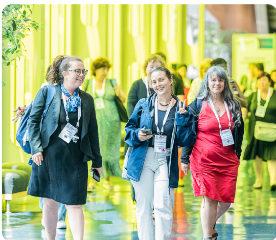
Les infirmières contribuent au travail du CII pour élaborer une stratégie globale, définir ce que sont les soins infirmiers, développer le leadership infirmier et renforcer la profession dans le monde entier.

« Depuis sa création il y a plus de 120 ans, le CII s'est toujours préoccupé de la formation des infirmières et a veillé à ce que les connaissances et l'expertise soient partagées aussi largement que possible. Cet effort se prolonge au XXI e siècle pour donner aux infirmières le meilleur accès possible aux informations dont elles ont besoin afin de créer le meilleur environnement de guérison pour leurs patients, où qu'elles se trouvent. »