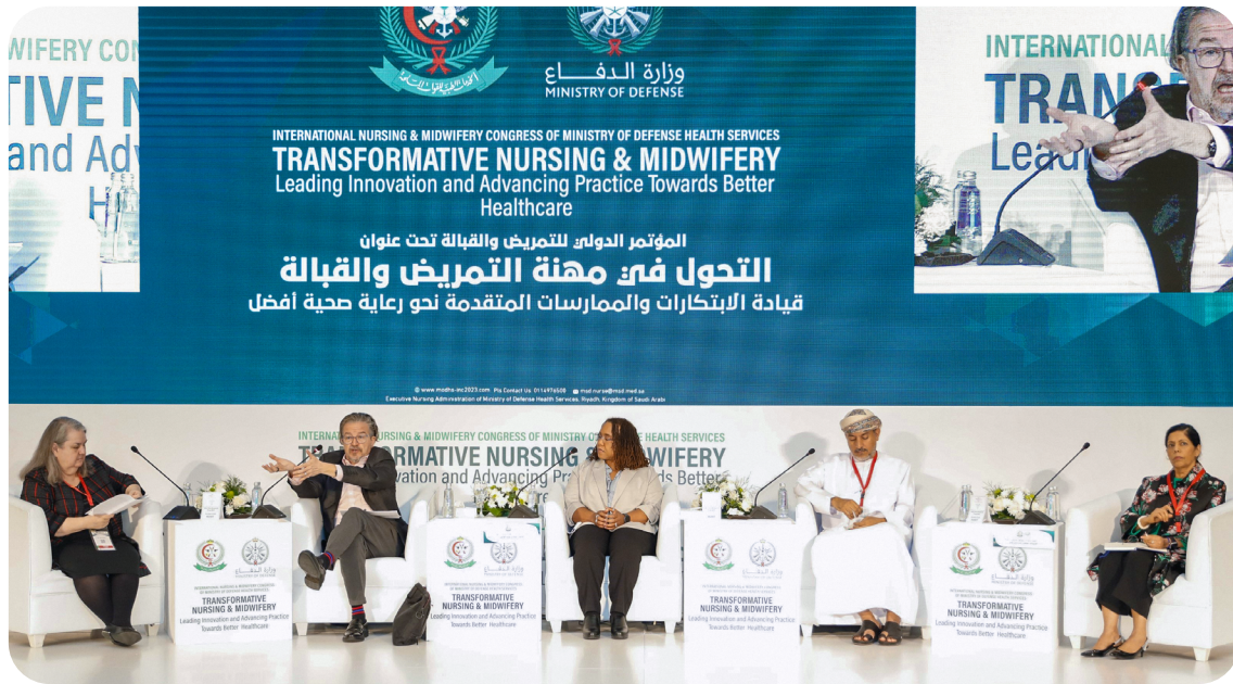
Le premier congrès international sur les soins infirmiers organisé par les services de santé du ministère de la défense d'Arabie saoudite s'est penché sur la santé mentale des infirmières.