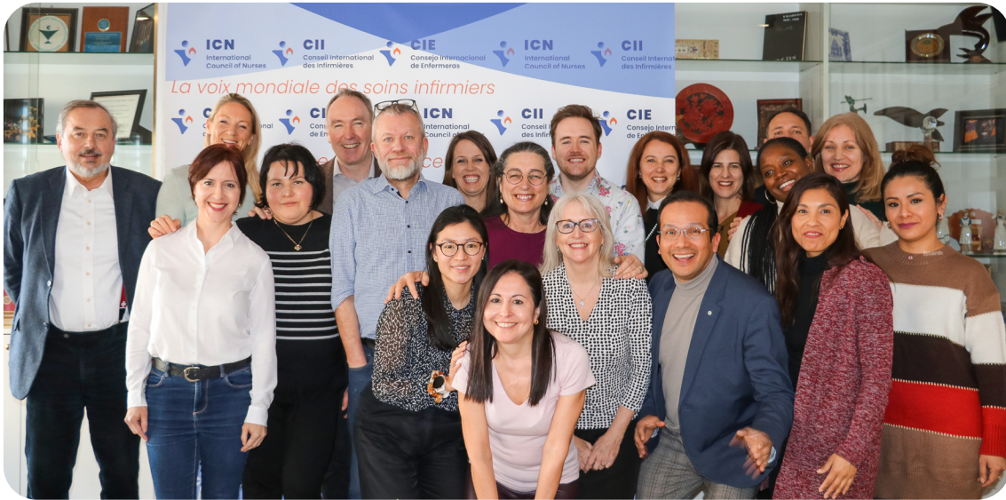
Le personnel du CII: une petite équipe passionnée et dévouée.