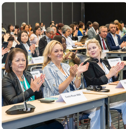
Les membres de la CRN se sont réunis à Montréal, au Canada, en juin 2023.

Associations nationales d'infirmières membres du CII