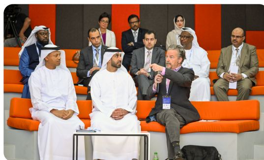
Le PDG du CII s'exprime lors du deuxième congrès international des soins infirmiers, des sages-femmes et des professions paramédicales à Abu Dhabi.

Notre Directeur général a prononcé un discours lors du deuxième Congrès international des infirmières, des sages-femmes et des professions paramédicales qui s'est tenu à Abu Dhabi (Émirats arabes unis) du 9 au 11 novembre 2023. Il y a notamment rappelé que l'un des principaux enseignements de la COVID-19 était que les infirmières jouent un rôle central dans la préparation, la prévention et la riposte aux pandémies.